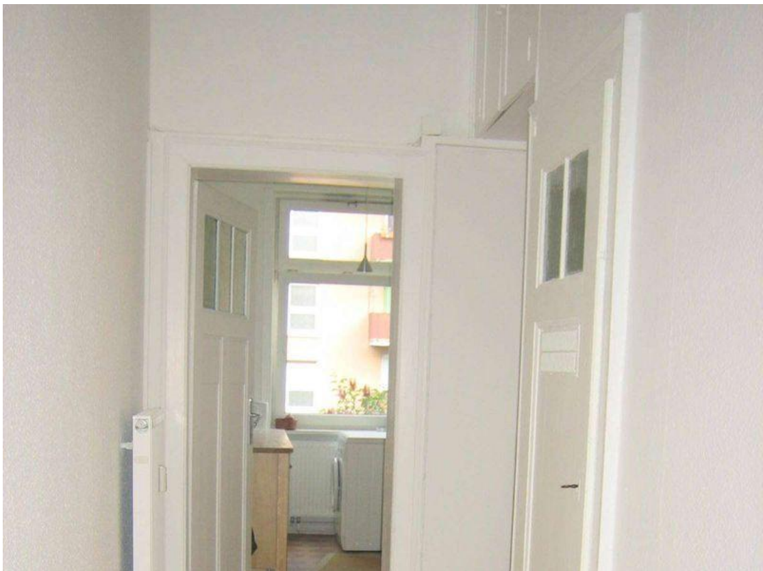
Flur mit Küchenblick -