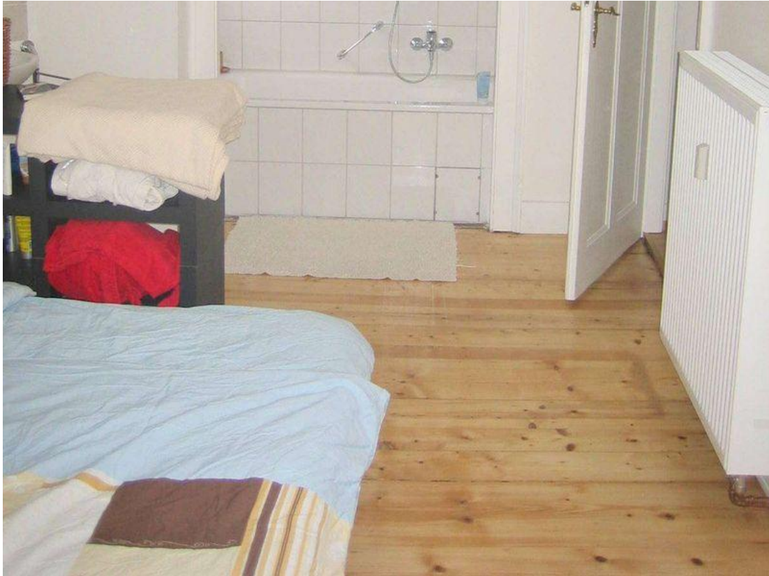
Schlafen mit Frankfurter Bad