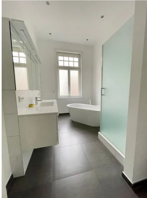
Tageslicht Dusch- und Wannenbad