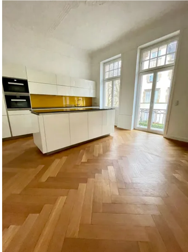
Wohnküche mit EBK