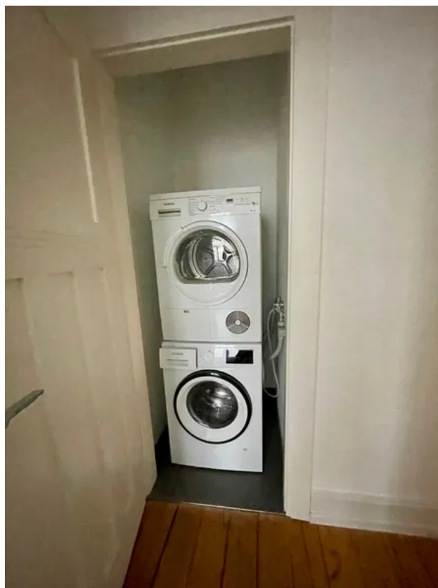
Raum Waschmaschine - Trockner